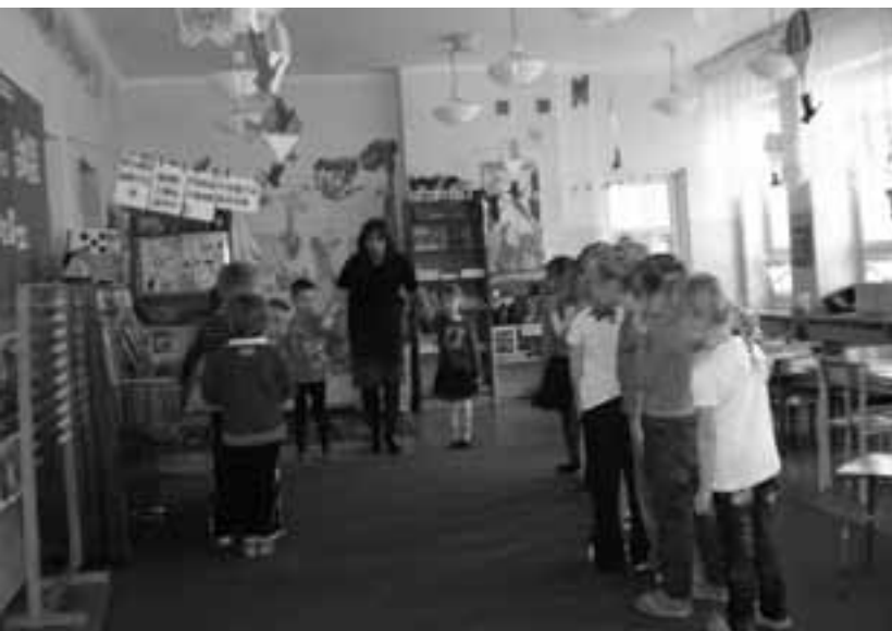
Warsztaty edukacyjne na temat wilka, wydry i bobra w przedszkolu w Monkach

Grupa dorosłych obejmowała zarówno nauczycieli wychowania przedszkolnego, szkół podstawowych i gimnazjów oraz osoby zajmujące się edukacją przyrodniczą w lokalnych instytucjach (80 spotkań). Okazuje się, że wiedza tych osób często jest niepełna lub błędna i wymaga weryfikacji i uzupełnienia. Na przykład, według dość powszechnie panującego błędnego poglądu bobry jedzą ryby, choć jest to gatunek typowo roślinożerny. Także część nauczycieli nie kryła swojego lęku wobec wilków – potwierdzało to ich przeświadczenie o konieczności